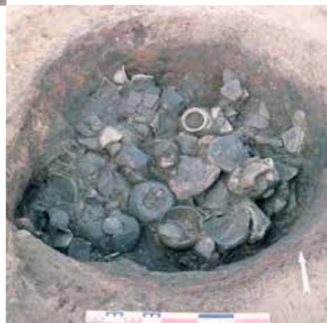
Pots abandonnés au fond d'un des fours découverts lors de fouilles archéologiques réalisées à Romans.