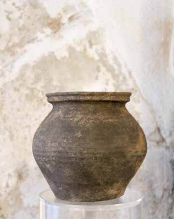
Céramique, 10 e - 11 e siècle, © CDP